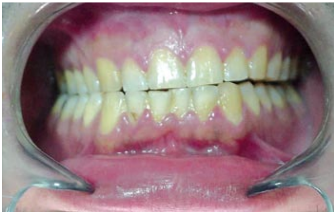
Figura 1: Signos de bruxismo en un paciente joven.